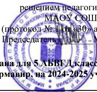
Таблица-сетка часов учебного плана для 5 АБВГД классов МАОУ СОШ № 18 с УИОП МО город Армавир, на 2024-2025 учебный год